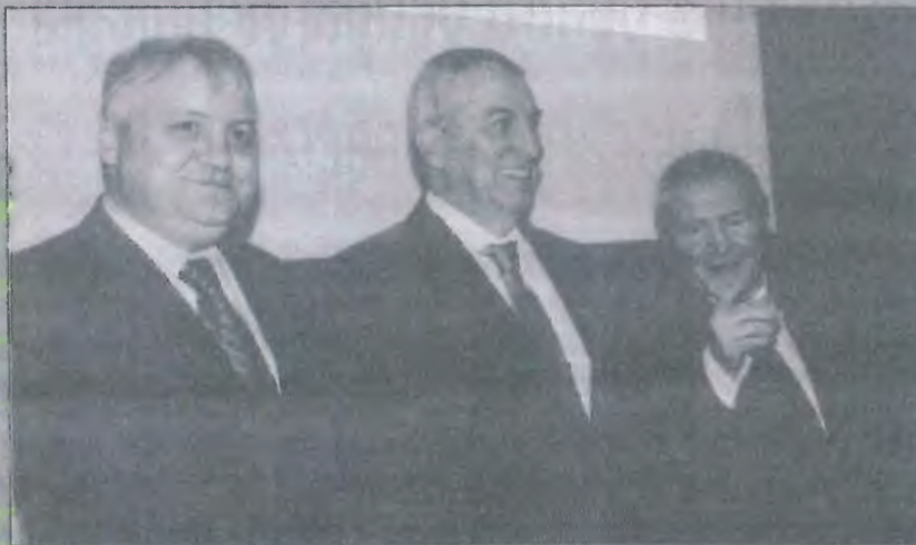
Foto: Șeful ALDE la nivel național se va afla din nou în județul Vâlcea. Călin Popescu Tăriceanu, care s-a aflat în județul nostru în marșale rânduri admirație pentru județul nostru al doilea om în stat, are o agendă plină pe parcursul vizitei de o zi în județul nostru, de marșale rânduri admirație pentru județul nostru al doilea om în stat, are o agendă plină pe parcursul vizitei de o zi în județul nostru.

„al doilea om în stat are o agendă plină pe parcursul vizitei de o zi în județul nostru